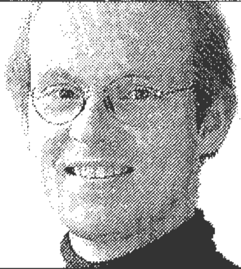
Von Sebastian Dullien

Fast unbemerkt gehen die wirtschaftswissenschaftlichen Fakultäten in Deutschland auf Erfolgskurs